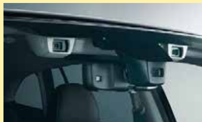
複眼カメラ