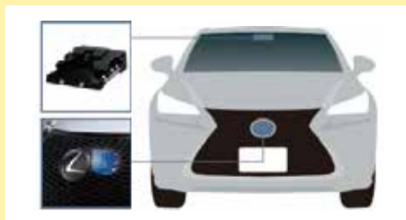
カメラ・ミリ波レーダー複合型